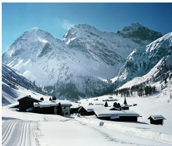
Abb.2: Die Winterlandschaft des Sertigtals 3

Ein erster thematischer Schwerpunkt soll dem Umgang mit den Naturgefahren gewidmet sein. Murgänge, Lawinen und Steinschläge haben den Walsern immer wieder das Leben schwer gemacht. Das Lernen, einerseits mit diesen Gefahren umzugehen und zu leben und andererseits Schutzmassnahmen zu ergreifen, erforderte von der Bevölkerung viel Kraft und Geduld. Beiden Aspekten soll in diesem Kapitel Rechnung getragen werden.